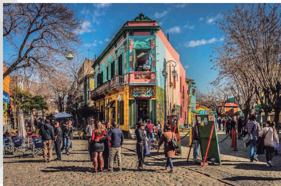
CAMINITO - LA BOCA